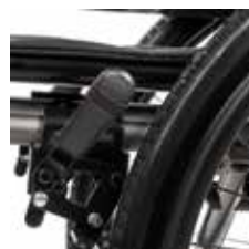
Freno de aluminio