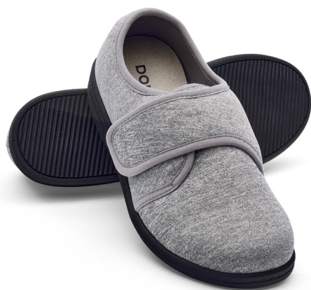
Empeine ligero y cómodo

Esta zapatilla liviana ofrece estabilidad confortable para hombres y mujeres con condiciones podológicas, ideal para el hogar o el entorno hospitalario