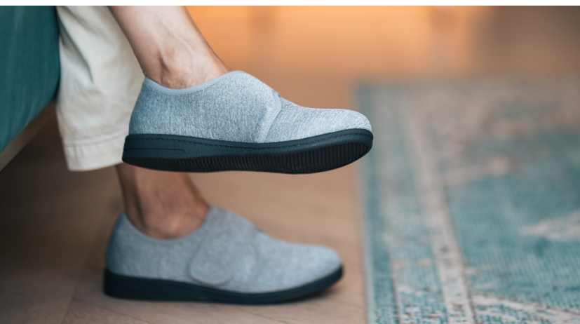
Suela ancha antideslizante