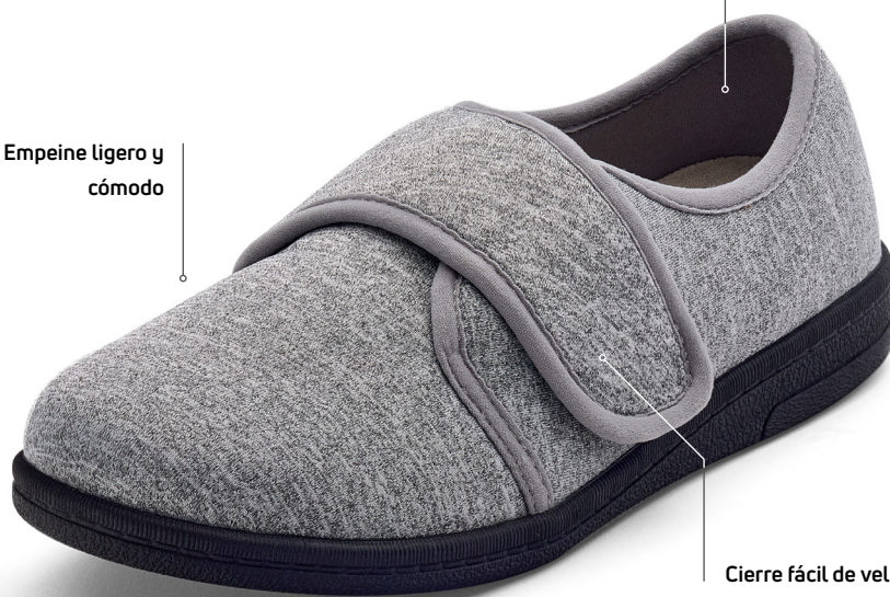
Interior suave y sin costuras